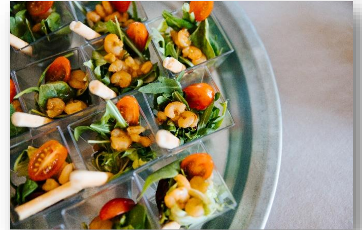
FOT. EKSKLUZYWNA STODOŁA HOWIEŃSKA