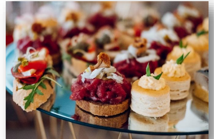
FOT. EKSKLUZYWNA STODOŁA HOWIEŃSKA