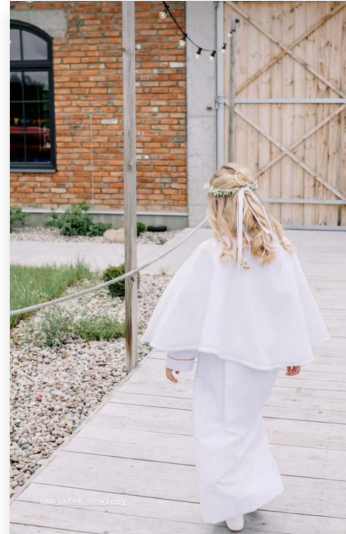
FOT. EKSLUZYWNA STODOŁA HOWIEŃSKA